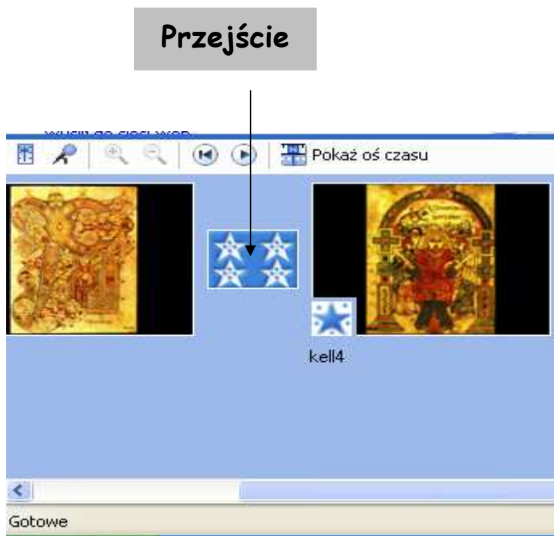
Projekt z przejściem na serii ujęć

Przejście można dodać między dwoma obrazami, klipami wideo lub tytułami w dowolnej kombinacji w serii ujęć/na osi czasu.