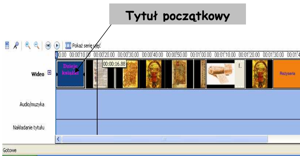
Tytuł początkowy na osi czasu

Na przykład można dodać tytuł wprowadzający osobę lub scenę ogladaną w filmie.