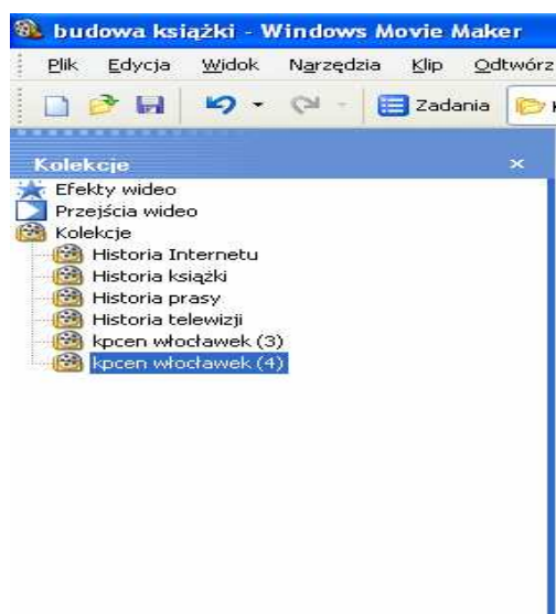
Przykładowe Okienko Kolekcje

W okienku Kolekcje są wyświetlane foldery kolekcji, które zawierają klipy. Foldery kolekcji są wyświetlane w okienku Kolekcje po lewej stronie, natomiast klipy w wybranym folderze kolekcji są wyświetlane w okienku