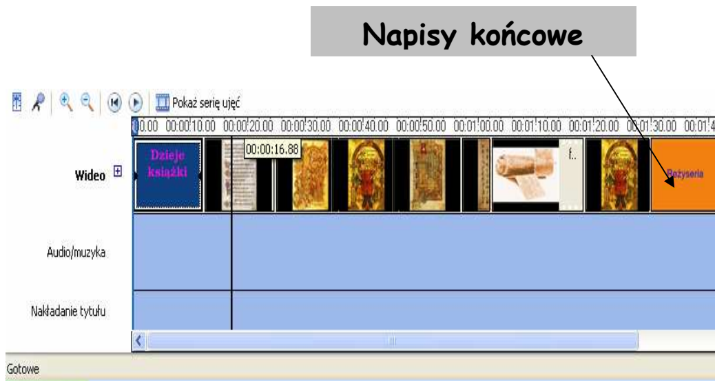
Napisy końcowe wyświetlane na końcu projektu