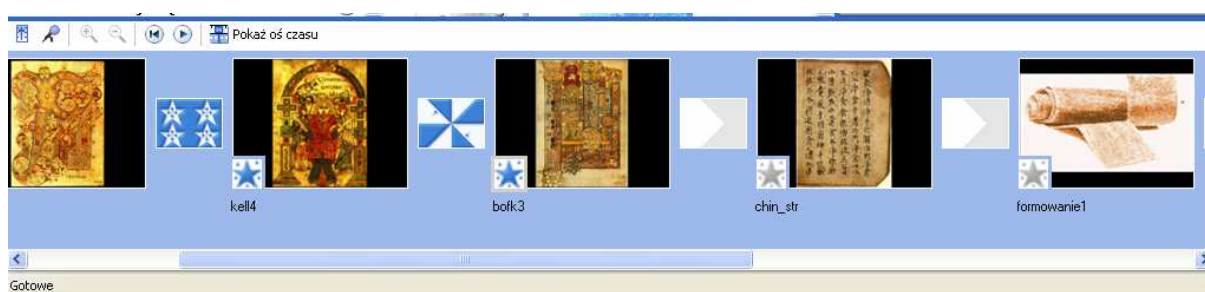
Widok serii ujęć w programie Windows Movie Maker

Seria ujęć. Seria ujęć jest domyślnym widokiem w programie Windows Movie Maker. Z serii ujęć można korzystać w celu obejrzenia danej serii klipów w projekcie oraz w celu łatwego przestawiania klipów, jeśli zachodzi taka potrzeba. Ten widok umożliwia również obejrzenie wszystkich dodanych efektów lub przejść wideo.